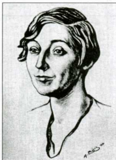
М. И. Цветаева