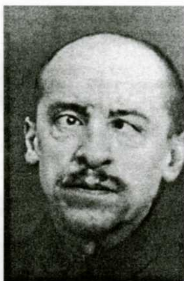
Иванов-Разумник (Разумник Васильевич Иванов)

Ты шуми, певунный Волохов, шуми. Разбуди Садко с Буслаем — на торгаш! Выше, выше, вихорь, тучи подыми! Ой ты, Новгород, родимый наш!