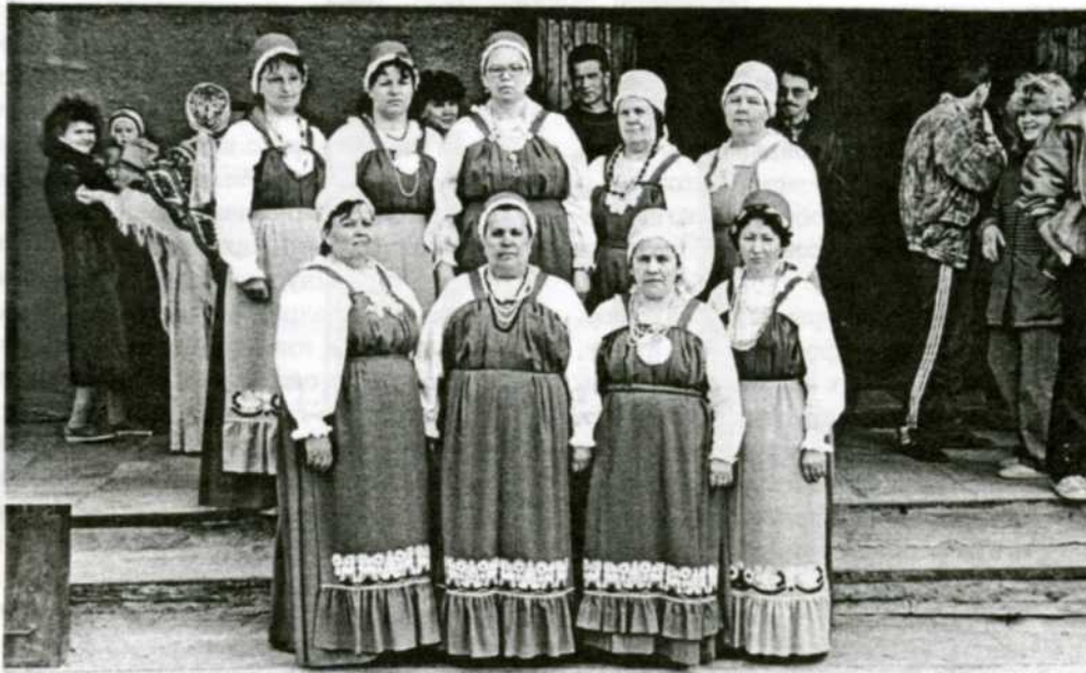
Фольклорный фестиваль, п. Умба