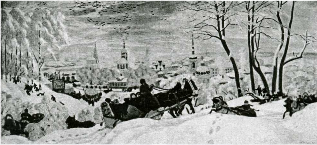
Б. М. Кустодиев. Масленица

Иное дело — народная обрядность, разрушенная гигантскими по масштабам миграциями населения, бегством из деревень в города, крушением быта, ссылками, уничтожением и перемещением деревень... Тридцатый год, год коллективизации, был для народной культуры подобен удару бритвой по горлу, перерезающий сразу все жизненные пути. Традиционный фольклор исчез почти сразу, единым годом. Те, кому было 14 лет в 1930-м, помнят еще, скажем, ту же свадьбу, старые протяжные и хороводные песни, кому было 11—12 лет — ничего уже не помнят, кроме мещанских романсов. Традиция была оборвана враз.